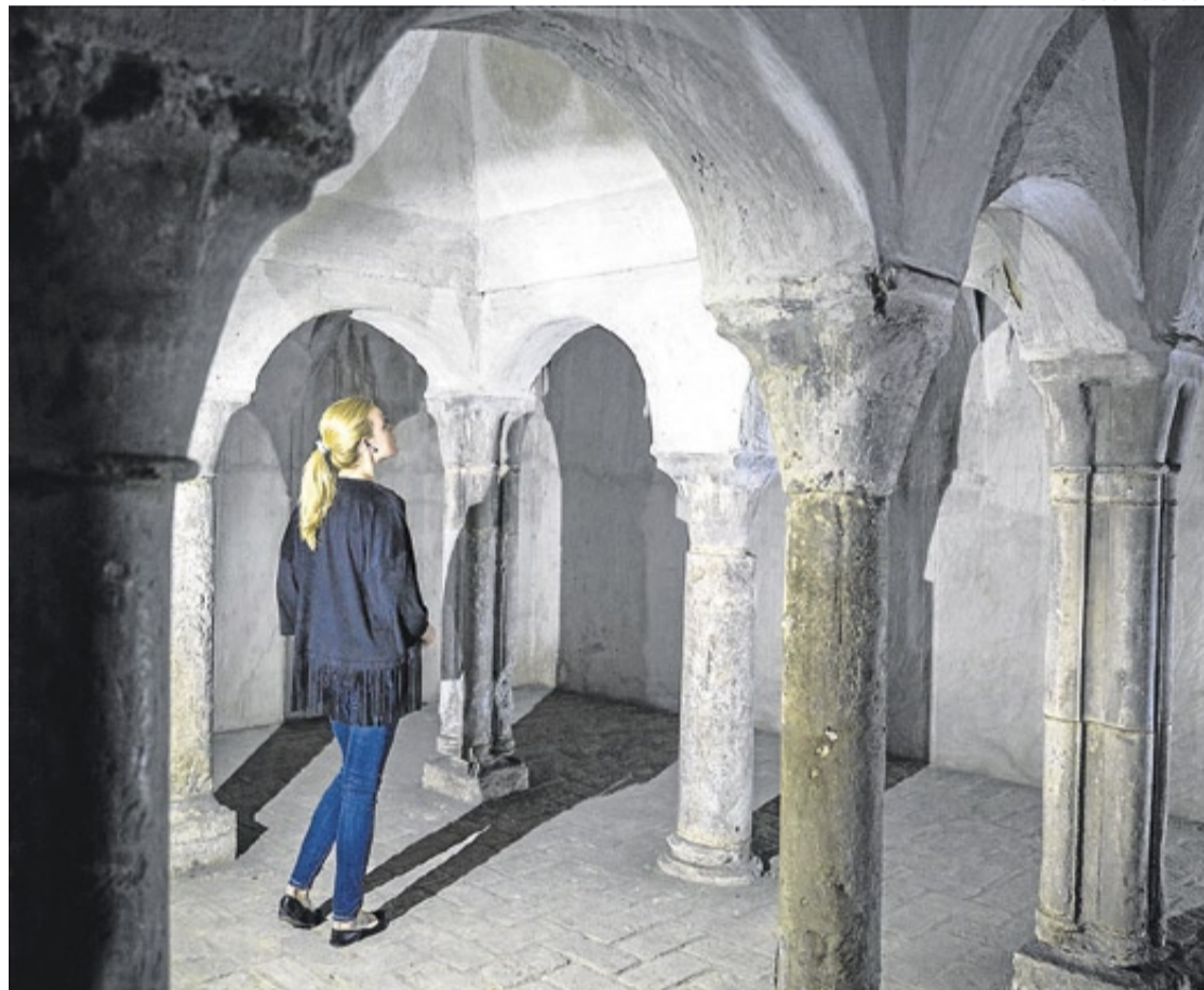
Bajo la calle. Interior de los Baños Judíos de Zaragoza, en un sótano de un bloque de pisos del Coso.

Los Baños Judíos se han conservado hasta ahora gracias al arquitecto que diseñó ese bloque de pisos. Para que no destruyeran los baños, el